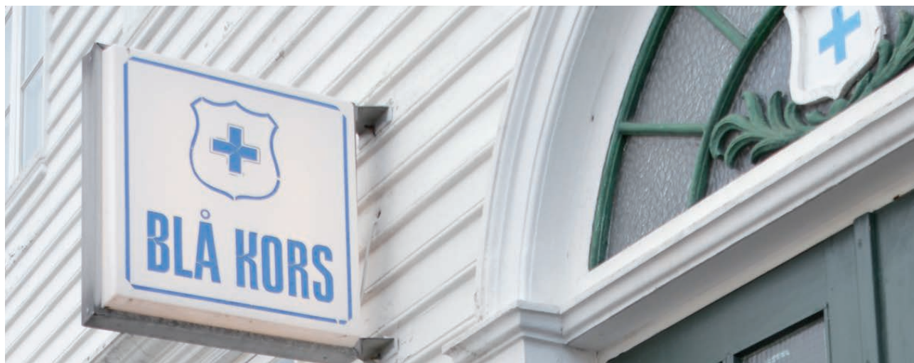
Blå Kors Kristiansand