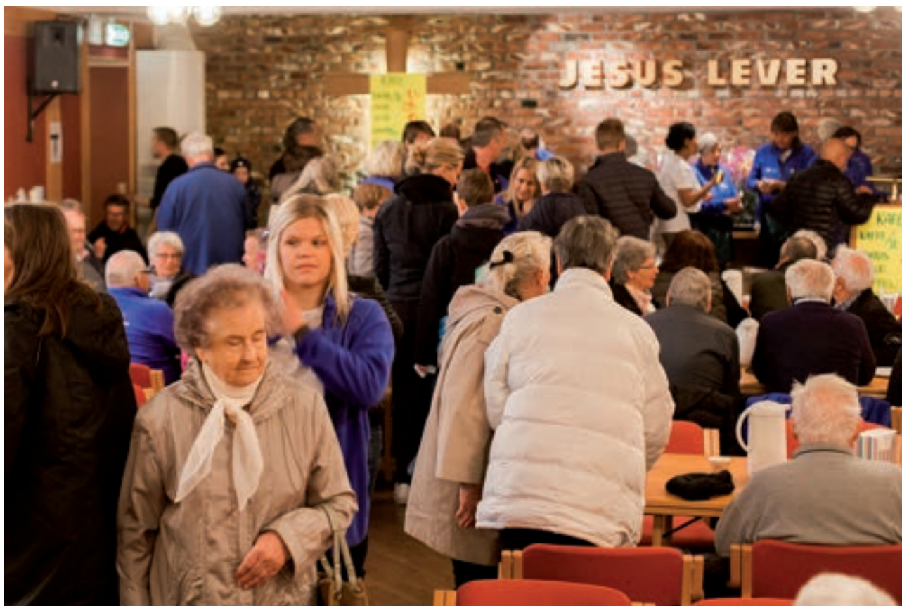
Fra Blåmarkedet 2015