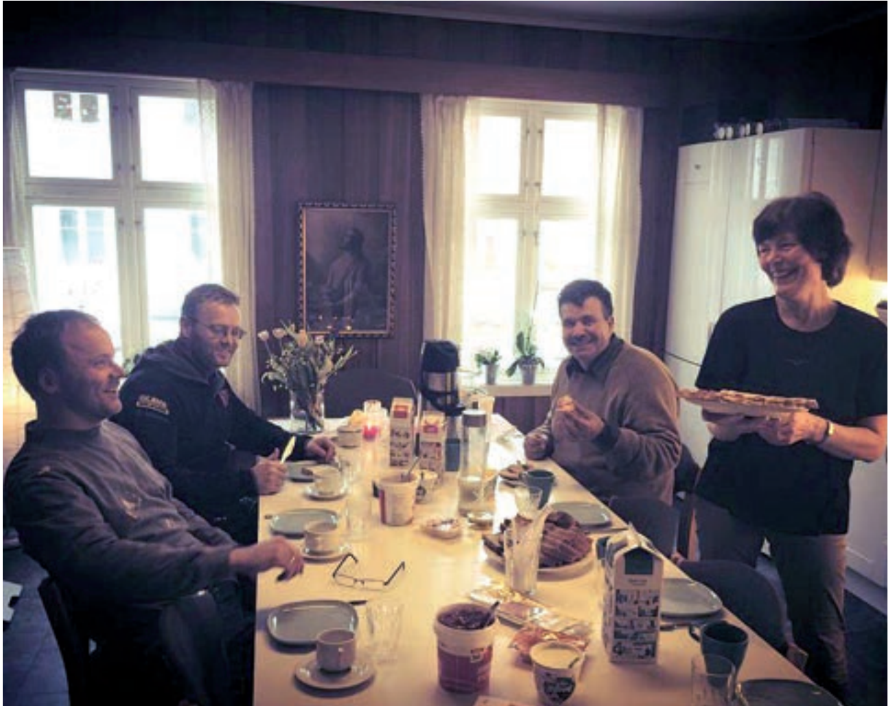
Fra Møteklassen til Posebyen Frivilligsentral