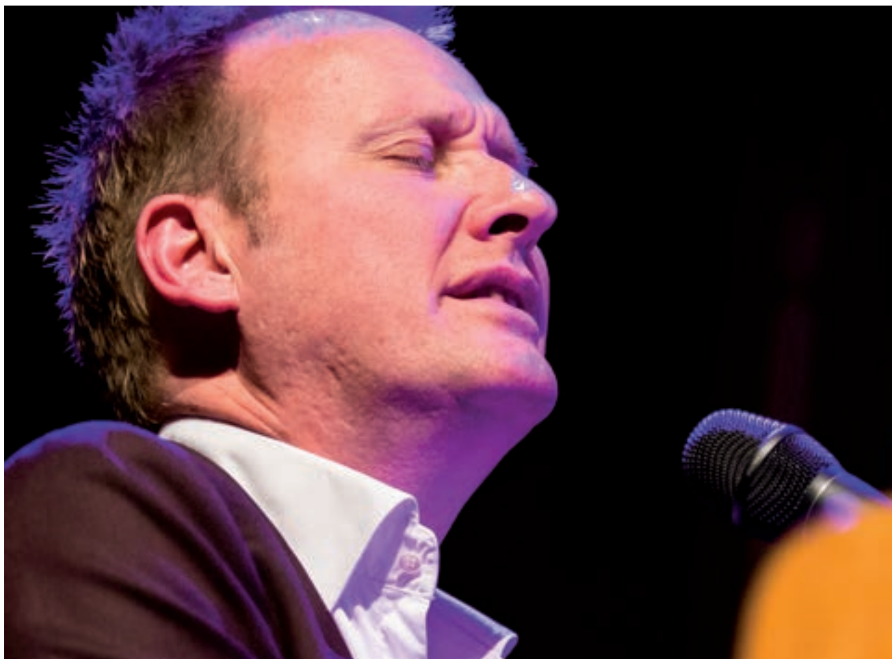
Sigvart Dagsland på Blå Torsdag i mars 2015 (Foto: Ivar Eidsaa).