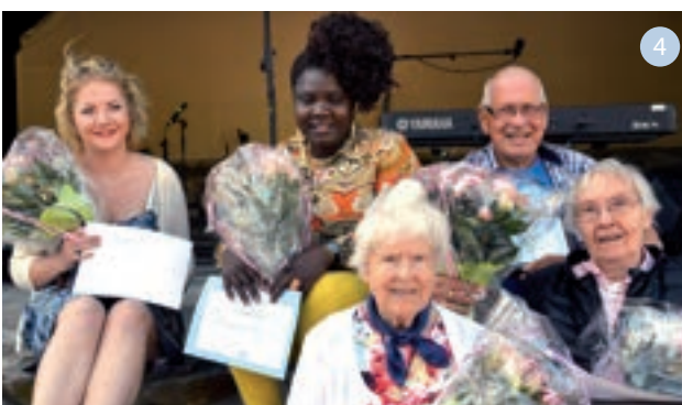
1. Fra NRK Sørlandets sak om flyktninger i september 2015 (NRK), 2. Tidgivere fra "Helaften i Blå Kors", desember 2015 3. Faksimile fra Fædrelandsvennen 17. april 2015: "Komper og Kristus" (Foto: Kjartan Bjelland), 4. Fra Blå Kors' sommerfest 2015

TORSDAGSMØTER: Torsdagskveldene i Blå Kors er en god tradisjon. I løpet av 2015 er det avholdt 18 møter fordelt på vår og høst. Også dette året har vi lagt vekt på å benytte forkynnere og sangere fra ulike evangeliske sammenhenger hvor budskapet om nåde, frelse og fornyelse har stått sentralt. Vi kunne nok ønske oss større besøk på disse kveldene. Besøkstallet varierer mellom 25-40 personer.